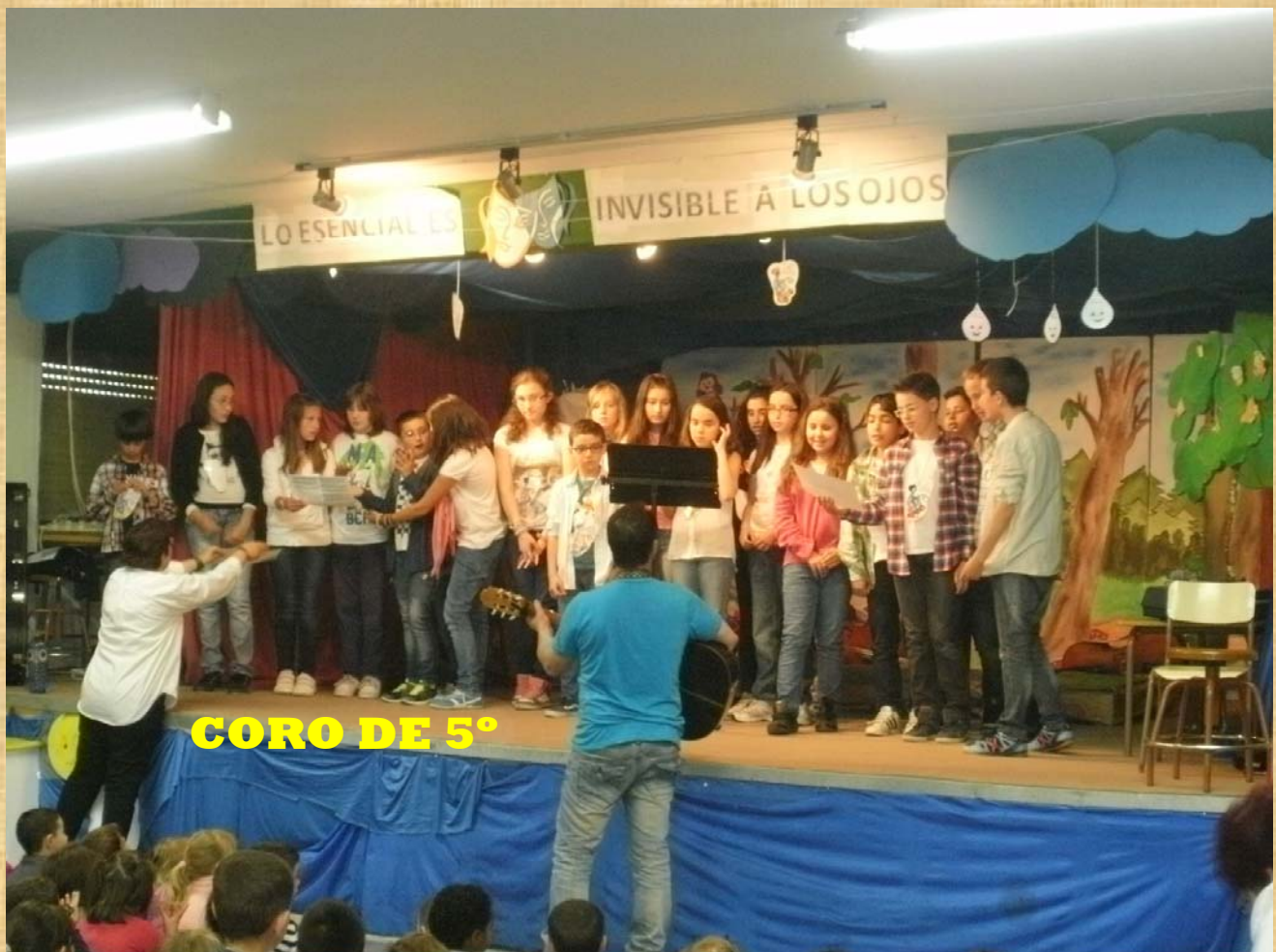
CORO DE 5°